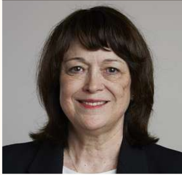
1947 - Linda Brown Buck