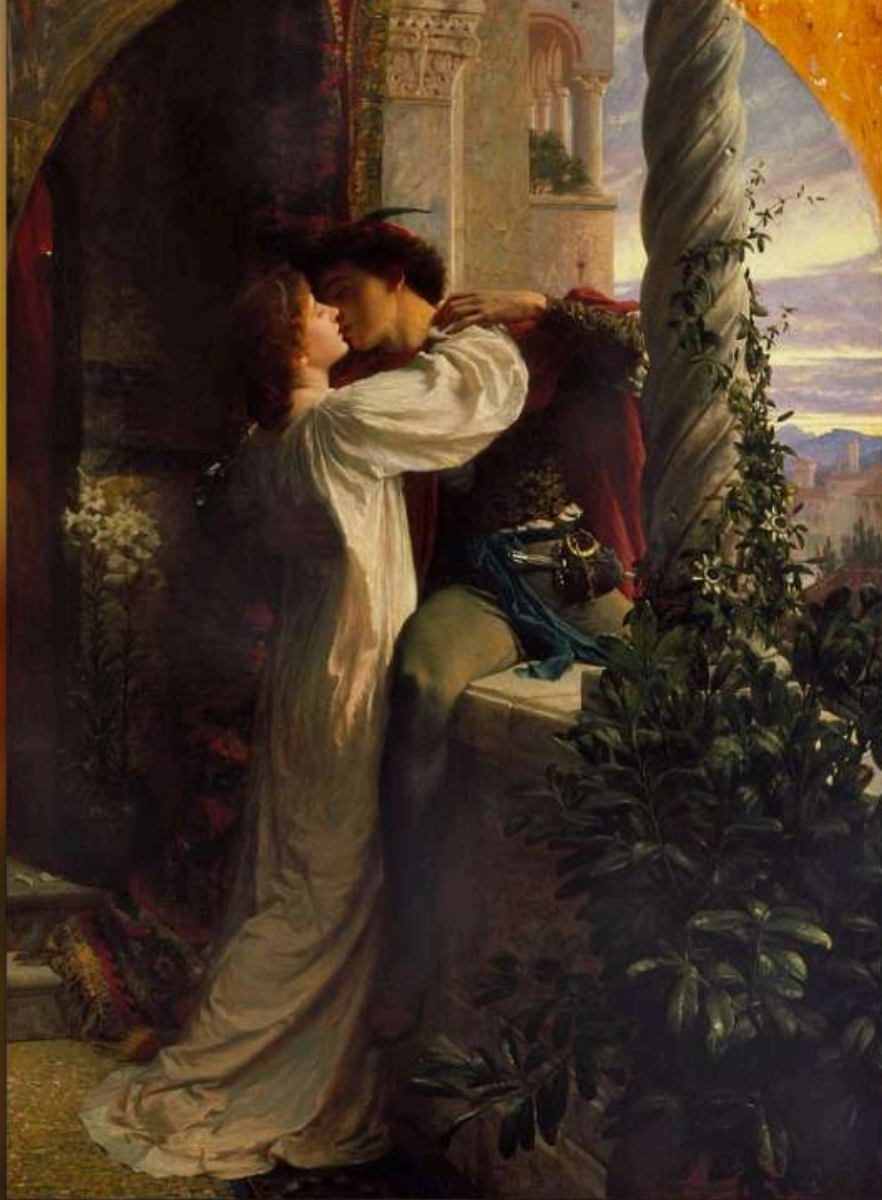
Representación de la famosa escena del balcón de Romeo y Julieta

El 29 de enero de 1595 se estrenó en Londres Romeo y Julieta, obra de William Shakespeare, hoy en día representada a nivel internacional en diferentes versiones y adaptaciones en prosa, verso, ballets y teatro. El argumento de la historia está basado en la primera versión de un cuento escrito por Luigi da Porto en 1520.