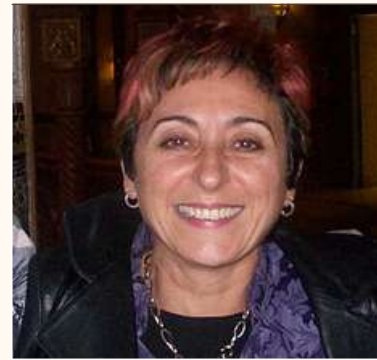
1957 - Elia Barceló

Es una bióloga, médica y profesora estadounidense. Descubrió cientos de genes que codifican los sensores olfativos ubicados en las neuronas olfativas de la nariz. Obtuvo en 2004 el Premio Nobel en Fisiología o Medicina (compartido).