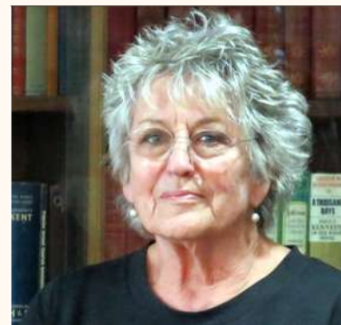
1939 - Germaine Greer

Es un pintor y titiritero mexicano. Sus trabajos son a base de óleo, pastel, lápiz y tinta. Su trabajo puede ser categorizado en Prehispánico mexicano, étnico, nacionalista, paisaje, retrato, posmoderno, religioso y antirreligioso, erótico, ecléctico, ficción y retrato social.