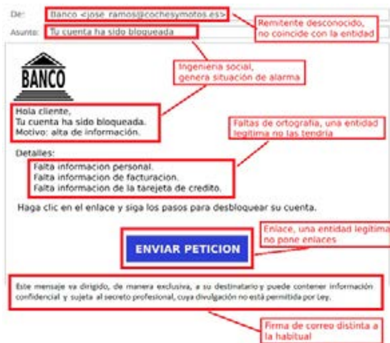
Ilustración 1. Ejemplo de correo electrónico fraudulento

Los correos electrónicos fraudulentos suelen contar con varias características que permiten su detección. A continuación, por medio del siguiente ejemplo se analiza un ejemplo de correo electrónico fraudulento.