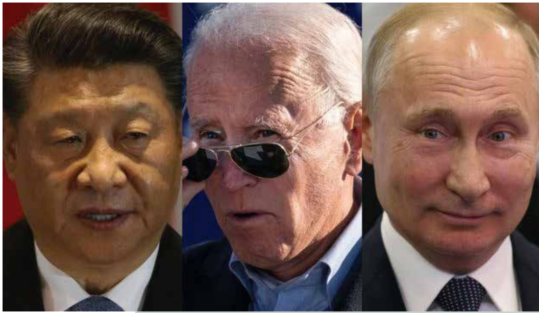
Xi Jinping, Joe Biden y Vladimir Putin.

Sin embargo, es claro que Estados Unidos no puede competir con China porque ha dejado de tener una economía productiva, pues ya no es una potencia industrial o comercial a nivel mun-