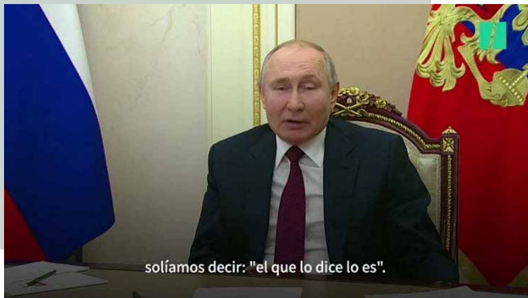
Vladimir Putin, captura de video.

En estos últimos días estuvimos muy cerca del estallido de un conflicto bélico muy grave que involucrara a Rusia (y atrás de ella a China) con Estados Unidos, parece que afortunadamente las élites del poder en Estados Unidos, sobre todo los militares, han entendido que en ese terreno ya no se pueden imponer porque los llevaría a un fracaso mayúsculo, esperemos que eso signifique que estaremos entrando a un periodo sino de cooperación por lo menos de coexistencia en una estructura multilateral de mayor equilibrio sin potencias hegemónicas.